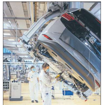
Да, немецкие авто — чудо техники. Но лучшие заводы уезжают из страны

Но и коллапс этого сектора не случился. Уже к весне 2023 года большинство малых и средних предприятий уменьшило энергопотребление, снижая